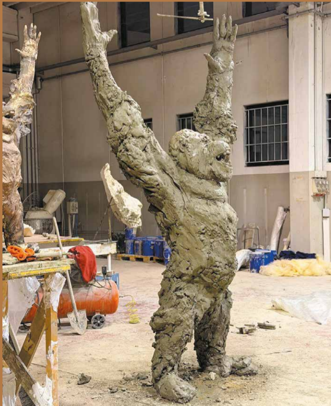
Orang-outan en terre © Davide Rivalta

Ses sculptures sont présentes dans d'importantes collections publiques et privées.