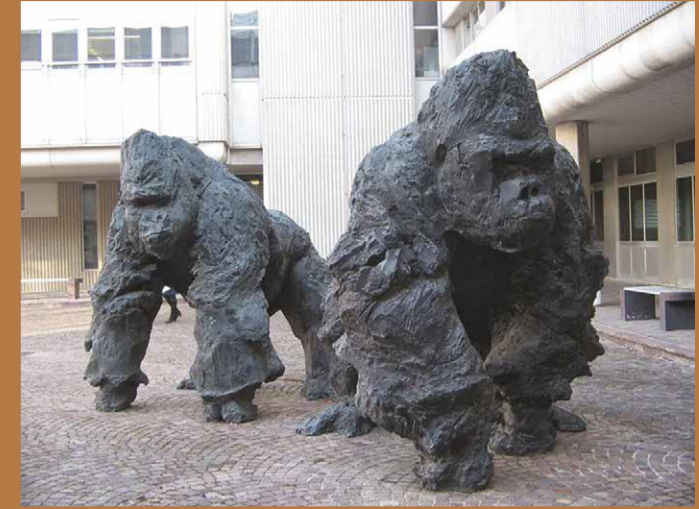
Gorilles, Ravenne (Italie) © Davide Rivalta