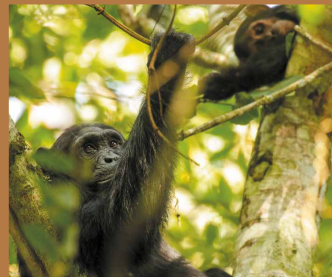
Chimpanzés

« Le lien entre culture animale et cognition est important et certaines espèces, comme les chimpanzés, peuvent être très obtues dans leur culture. En particulier, face à une expérience de terrain où elles doivent extraire du miel d'une bûche. Alors que tous les chimpanzés dans le monde utiliseraient un bâton, un groupe de chimpanzés à Budongo n'a jamais utilisé de bâtons, ni considéré ces objets comme des outils. J'ai même observé une femelle qui s'appelle « Night », extraire un bâton couvert de miel de la bûche, sucer ce dernier comme si c'était une sucette, s'en débarrasser puis regarder la bûche sans trouver de solution pour récupérer le miel. Pour eux, le bâton n'est pas un outil. Il ne fait pas partie de leur culture. »