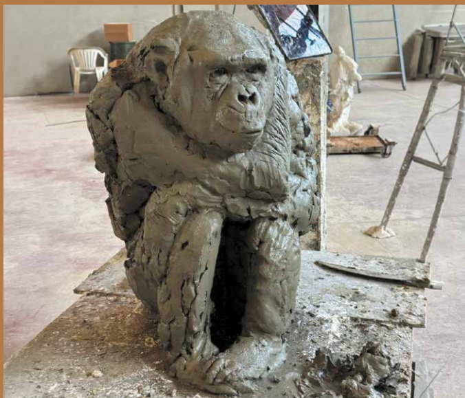
Chimpanzé en terre © Davide Rivalta