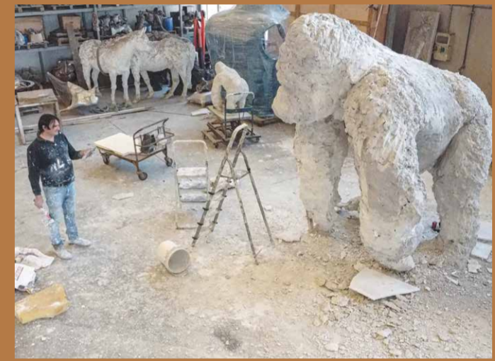
Rivalta dans son atelier © Davide Rivalta