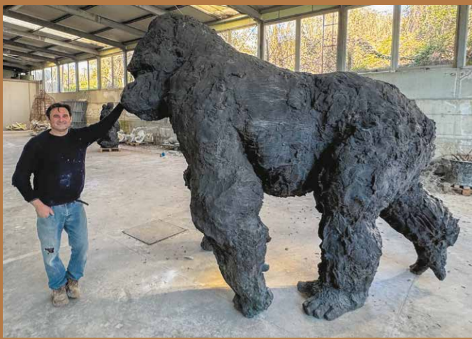
Gorille, atelier de Turin (Italie) © Davide Rivalta