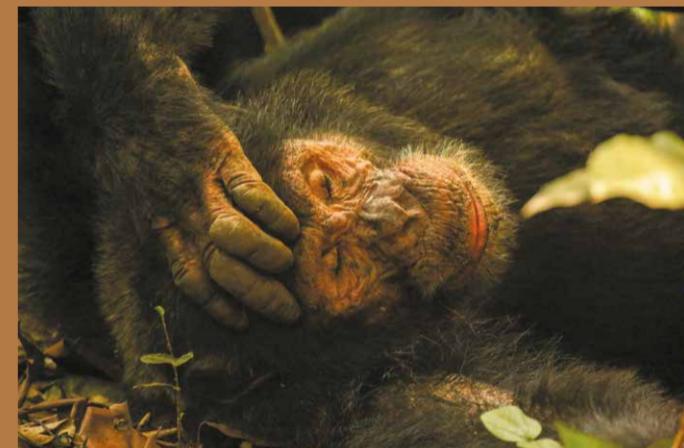
Chimpanzé dormant