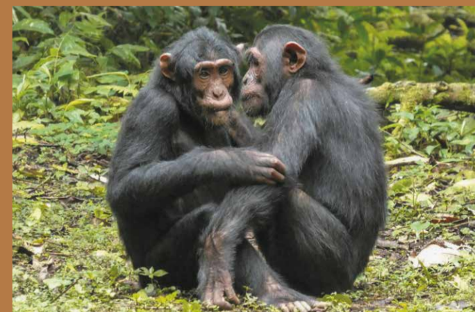
Chimpanzés © Isaline Graf